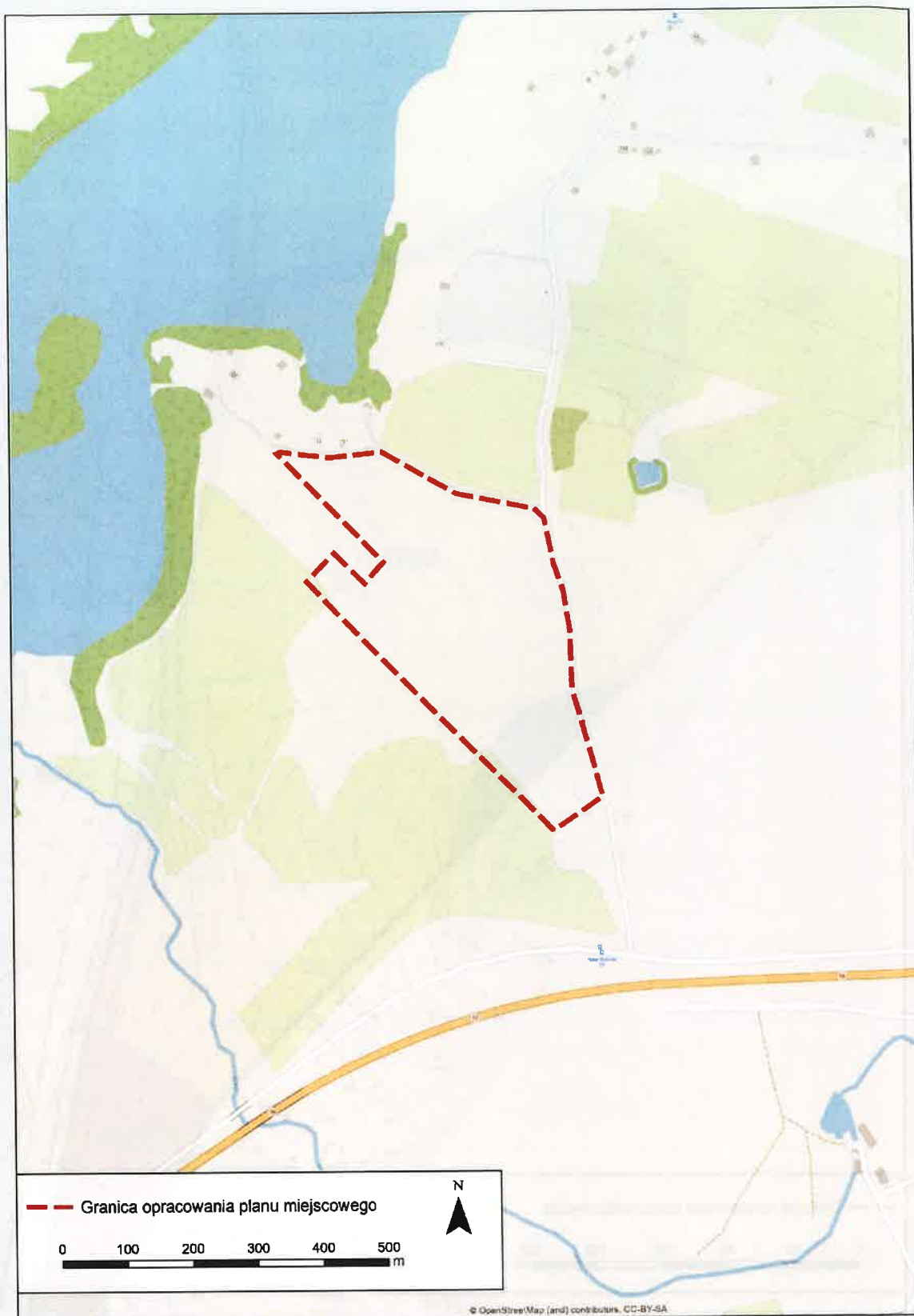
Rys. 2. Lokalizacja obszaru proponowanego do objęcia planem miejscowym na podkładzie OpenStreetMap