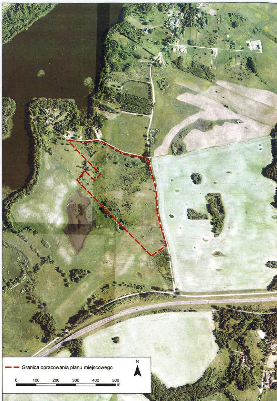
Rys. 3. Lokalizacja obszaru proponowanego do objęcia planem miejscowym na podkładzie ortofotomapy